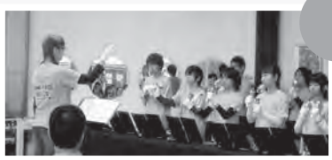
リンリンロックによる ハンドベル演奏

たくさんの方に来ていただき、大盛り上がりのホームカミングデーでした。今年もご来場をお待ちしております。