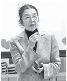
大谷学園長によるあいさつ