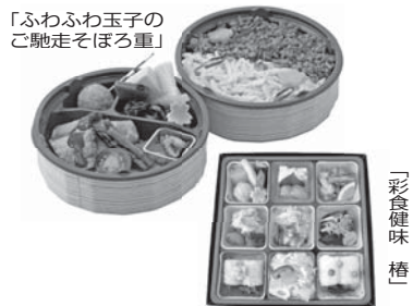
「ふわふわ玉子のご馳走そぼろ重」