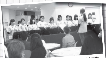
リンリンロックによるハンドベル演奏

たくさんの方に来ていただき、大盛り上がりホームカミングディでした。今年もご来場をお待ちしております!