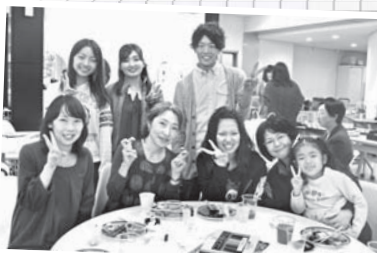
大人も子どもも楽しめました!