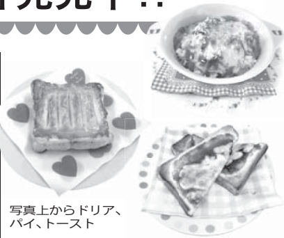
写真上からドリア、パイ、トースト